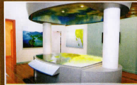
มรดกธรรมชาติและวัฒนธรรมแห่งชาติ The Natural and Cultural Heritages of Trat