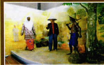
ผู้คนเมืองตราด The People of Trat