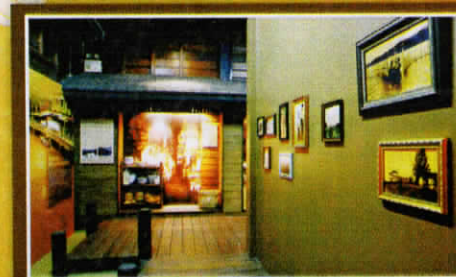
ตลาดเมืองตราด Market and Merchandise