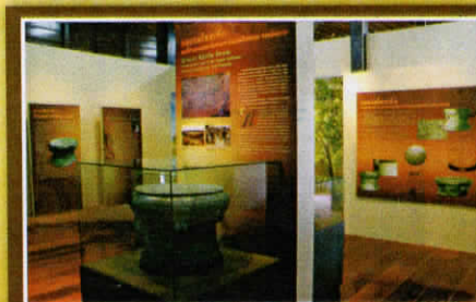
ลำดับทางโบราณคดีและประวัติศาสตร์เมืองตราด A Panorama of the Archaeology and History of Trat