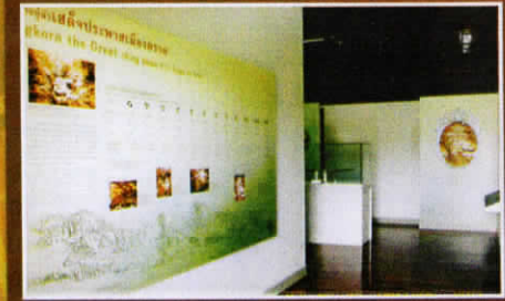
เหตุการณ์สำคัญในสมัย พระบาทสมเด็จพระจุลจอมเกล้าเจ้าอยู่หัว Major Events in the Reign of King Chulalongkorn The Great